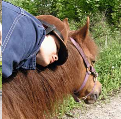
Equitation thérapeutique Il est prouvé que le contact avec les chevaux a des effets positifs sur le bien-être physique et mental.