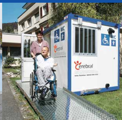
Container sanitaire Les toilettes mobiles accessibles aux handicapés pour les expositions, fêtes, concerts et autres manifestations publiques.