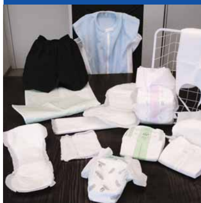
Articles de soins Une large gamme, de la lange à jeter à l'alèse.