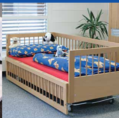
Lits de soins Avec le lit de soins réglable en hauteur, on passe du lit au fauteuil sans efforts.