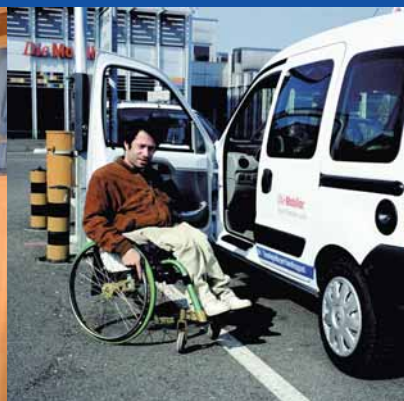
Auto-école Plus d'autonomie et d'indépendance avec des véhicules transformés et une formation de conduite spéciale.