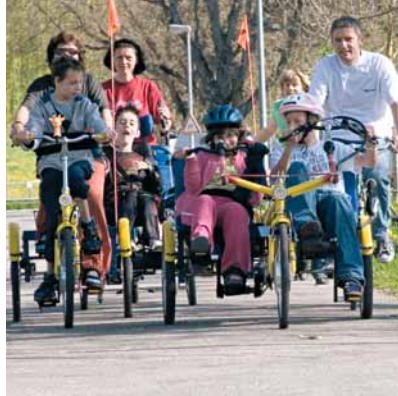
Vélos spéciaux Divers instruments auxiliaires permettent d'être plus mobile et d'améliorer la qualité de vie.