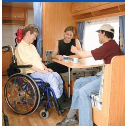
Mobil-home Profiter des vacances en mobil-home avec tout le confort dont les handicapés peuvent rêver.